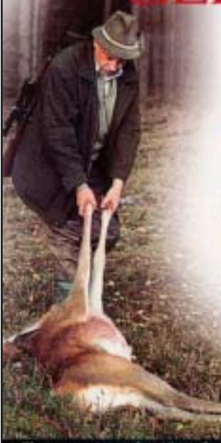
Ein ganz normaler Jäger hatte jagdlichen Erfolg. Hat er getötet, um getötet zu haben?

Jagt der Jäger, um zu töten? Nein, er jagt, um Beute zu machen. Und obwohl dieses „Beutemachen“ untrennbar mit dem Tod verbunden ist, gibt es kaum einen Jäger, der jagt, um zu töten. – Die Unterschiede dazwischen werden im folgenden Beitrag deutlich.