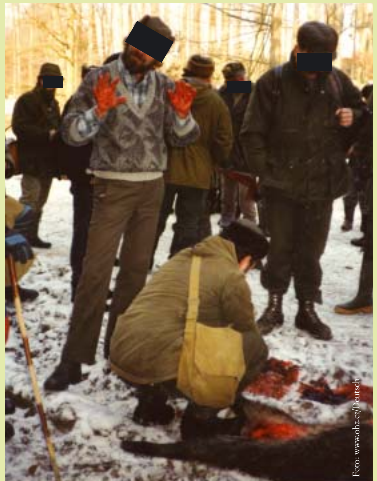
Psychoanalytiker: Unterdrückte Aggressivität bei der Jagd ausgelebt.