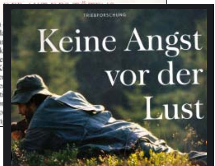
Jägerzeitschrift WILD UND HUND