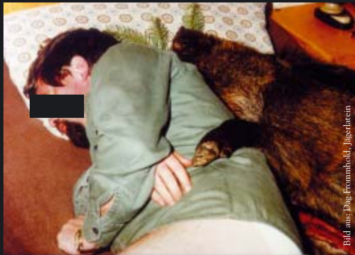
Lustiges »Schüsseltreiben« nach der Jagd