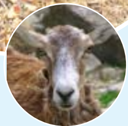
Bilder: Freiheit für Tiere